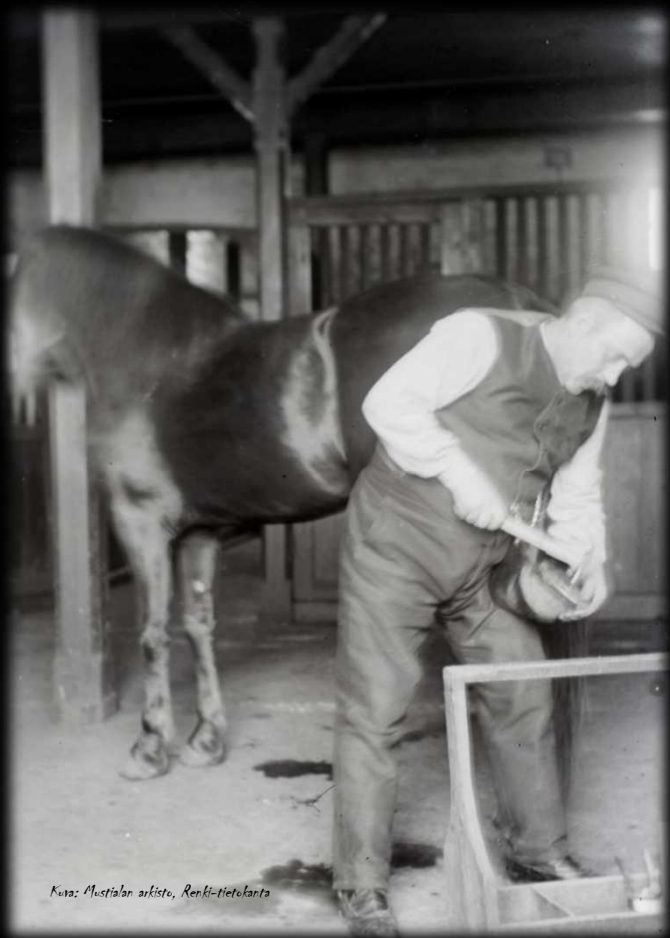
Kuva: Mustialan artisti, Renki-tietolanta