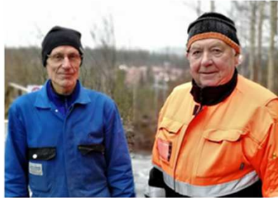
Elämysportaat kohoavat kökkähengellä