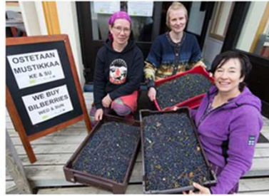
Marjat talteen ja markkinoille! Kerupilotti rakentaa tuoteketjua kuntoon