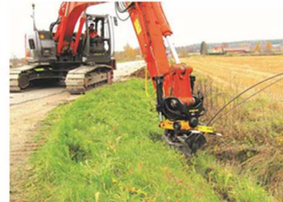
Laajakaista tuli kylään