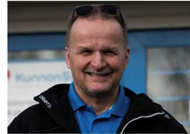
Kokonaisvaltaista hyvinvointia – hyvinvointiyrittäjä investoi Leader-rahoituksella