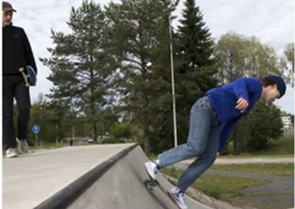
Rullailua, hengailua ja vaikuttamisen oppitunti