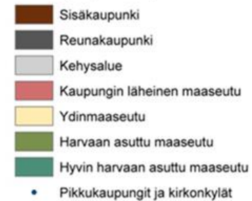
Aluetyypologia - kaupungin ja maaseudun paikkatietopohjainen raja