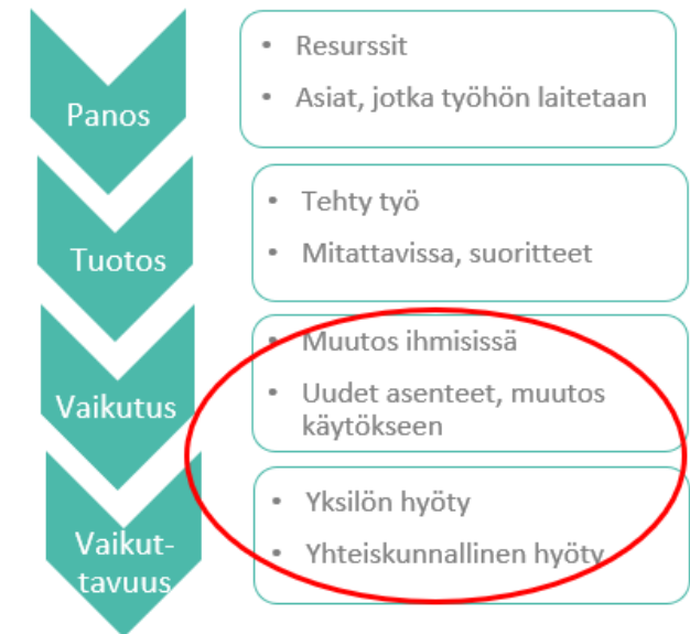
Kuva: Vaikuttavuusajattelun logiikkaketju (Aistrich, 2014)