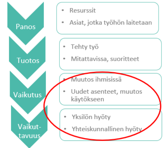
Kuva: Vaikuttavuusajattelun logiikkaketju (Aistrich, 2014)