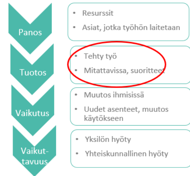
Kuva: Vaikuttavuusajattelun logiikkaketju (Aistrich, 2014)